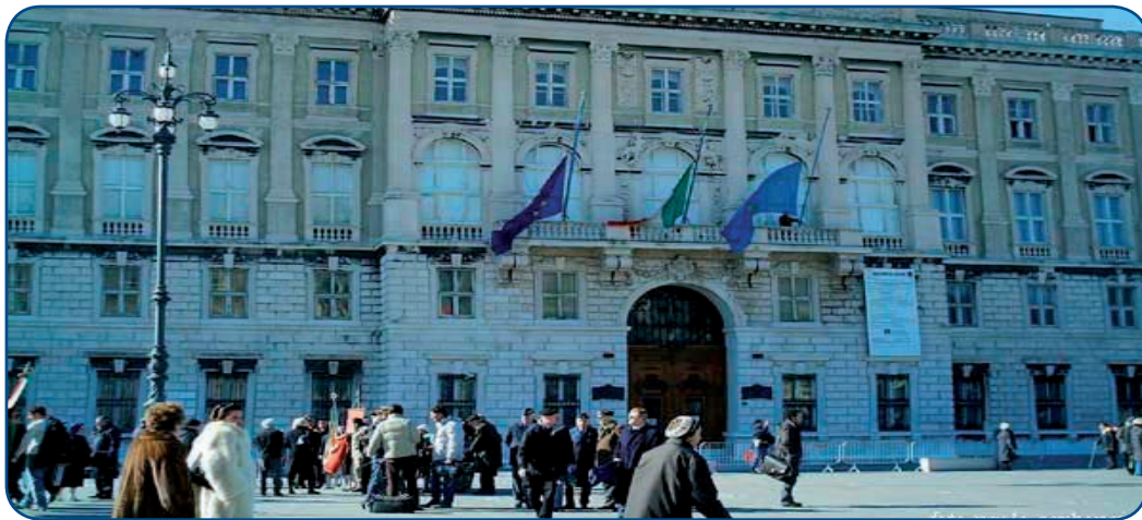
Trieste - Palazzo della Giunta Regionale FVG