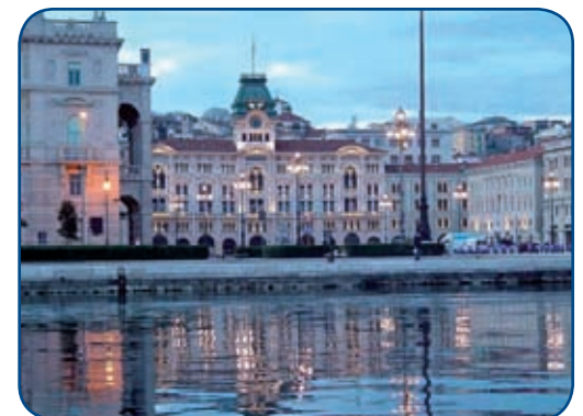
Trieste – le rive.

La strada comunque è ancora lunga. Ci sono anche altre due proposte di legge, una PDL l'altra PD (vecchio progetto Jacop) e quindi aspettiamo fiduciosi l'evolversi della situazione confidando che nel corso del dibattito e delle audizioni, che certamente coinvolgeranno i rappresentanti della categoria, si possa arrivare ad un testo innovativo e, per quanto più possibile, condiviso.